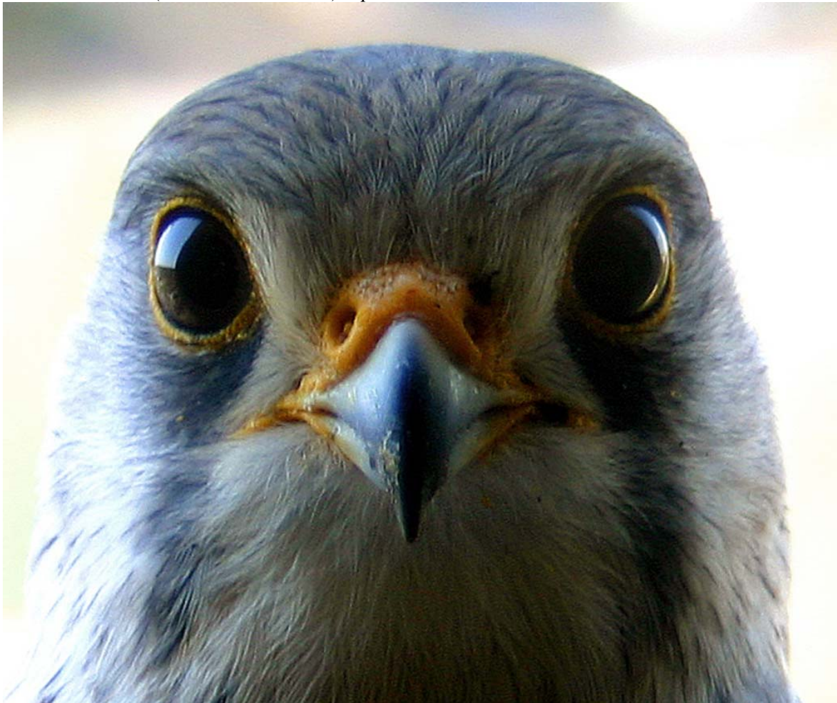
Poštolka obecná ( Falco tinnunculus ) - portrét samce

Televizní přijímač s přenosem z ptačí budky je umístěn v půdních prostorách a je součástí prohlídky hradu.