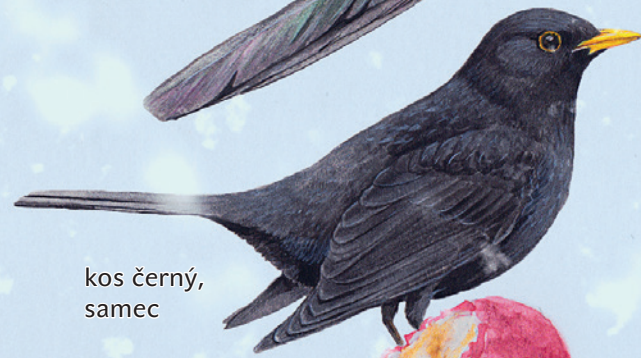
kos černý, samec