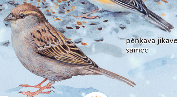
pěnkava jikavec, samec