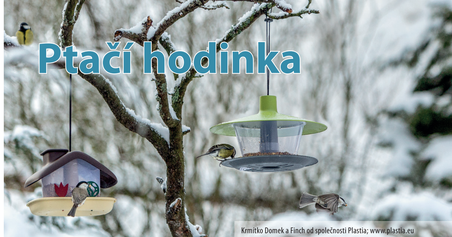
Krmítka Domek a Finch od společnosti Plastia; www.plastia.eu

Sýkora modřinka na kokosu s náplní, který můžete objednat na www.zelenadomacnost.com