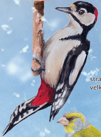
strakapoud velký, samec